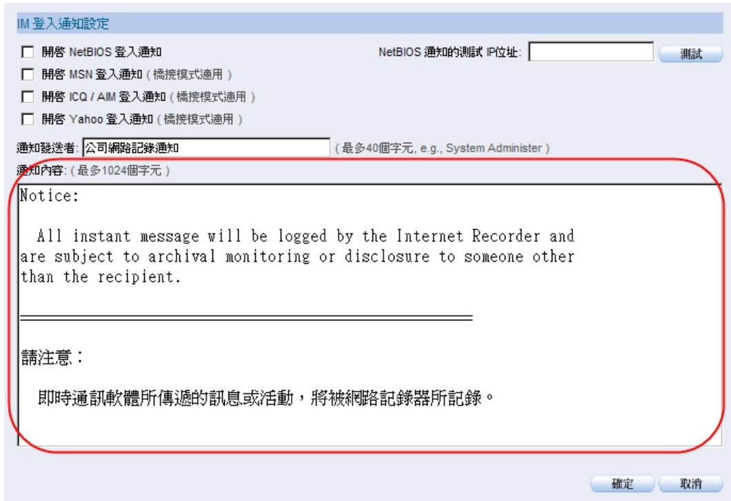
於系統介面『行為管理 > 即時通訊管理 > 登入通知』設定即時通訊軟體登入通知訊息