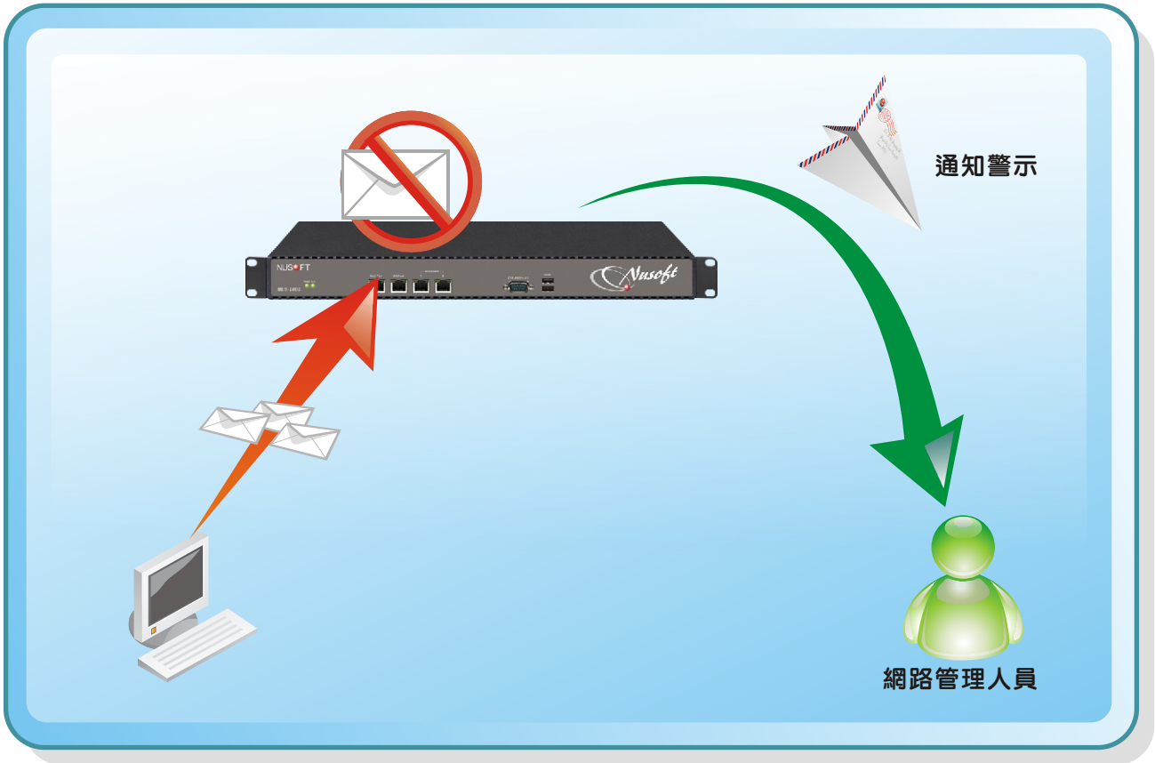
內部郵件寄送異常示意圖

如此一來，不但讓公司郵件安全多一層把關，同時也為管理人員多填增了管理搭配的靈活性。