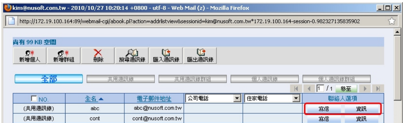
可於通訊錄中直接點擊寫信與進一步查看該帳號相關資訊

除此之外，更加強了通訊錄中的使用功能，貼心的增加了讓使用者於找尋信箱通訊錄的同時，也能直接針對通訊錄中的帳號直接進行寫信動作，還可進一步的查看該帳號的相關資訊之功能，改掉以往只能從編輯新信裡加入通訊錄帳號的不便，提供更加人性化的使用者操作方式。