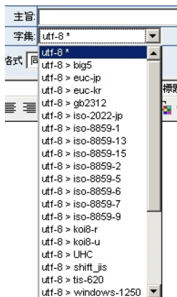
使用者可直接於編寫新信件的時候，進行自訂編碼

於編寫新信件時，也特別增加了可自訂編碼功能，讓使用者在針對與國外客戶通信時也不必煩惱因地區編碼不同而增添溝通上不良的問題，提升事情處理效率，同時也為公司帶來更可觀的收益與商機。