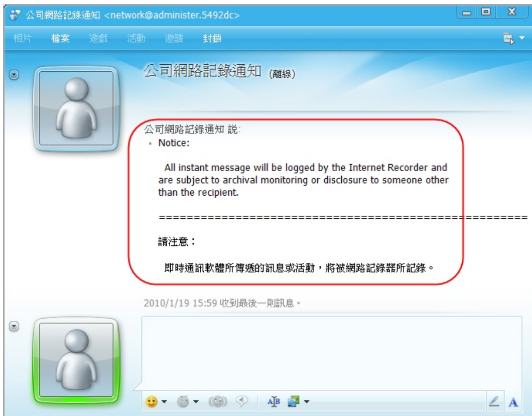
员工登入实时通讯软件时，会立即出现相关讯息告知