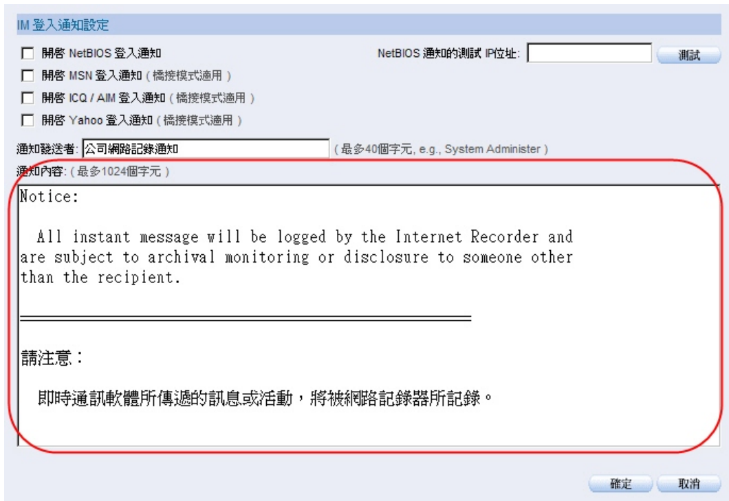
於系統接口『行为管理 > 实时通讯管理 > 登入通知』设定实时通讯软件登入通知讯息