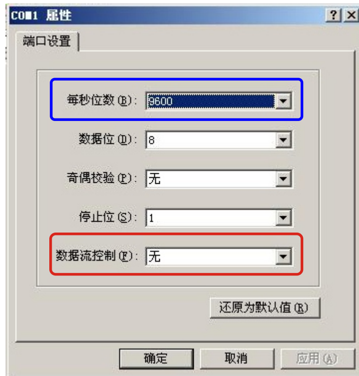
每秒位数需依照欲连接的机型来设定不同的数值

而若是管理人员欲连接的机器机型为 MS700、MH700 时，所设定的每秒位数就须要设定为『115200』才有办法正常连入。