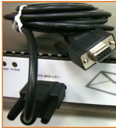
连接机器、卷好并放置于机壳上

如此一来即可快速的提供经销商或 Support 人员所需的 Console 接口，来解决一些可利用 Console 就可解决的问题，省掉不少设备送修的时间，影响公司正常运作，及不必要的金钱花费。另外还需要提醒管理人员的一点则是，由于 Console 线并不是经常会去使用到的东西，所以很容易被放置于其它地方，因而当问题发生时，却时常会出现找不到的情况，导致原本可以利用 Console 就可解决的问题变成需要送厂维修，一来一回浪费了不少时间与不必要的费用。建议管理人员可先行将 Console 线一头连接机器设备后再将其余的部份卷好并放置于机壳上，以防不时之需。