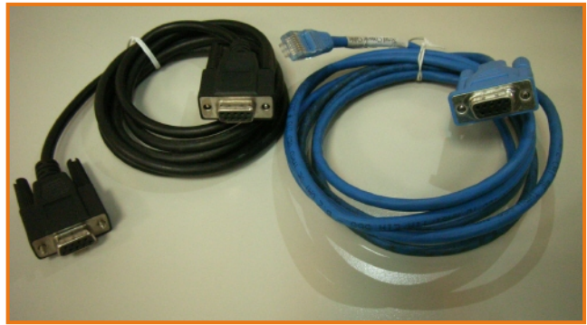
两种 Console 线

于 COM1 内容中还需设定『每秒位数』与『数据流控制』两项，将『数据流控制』设定为“无”，此时需特别注意到的则是『每秒位数』这项目的设定数值(下图蓝框部份)。