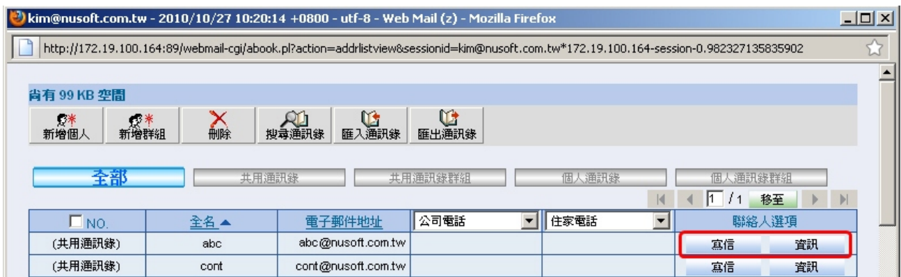
可于通讯簿中直接点击写信与进一步查看该帐号相关信息

除此之外，更加强了通讯簿中的使用功能，贴心的增加了让使用者于找寻信箱通讯簿的同时，也能直接针对通讯簿中的账号直接进行写信动作，还可进一步的查看该账号的相关信息之功能，改掉以往只能从编辑新信里加入通讯簿账号的不便，提供更加人性化的使用者操作方式。