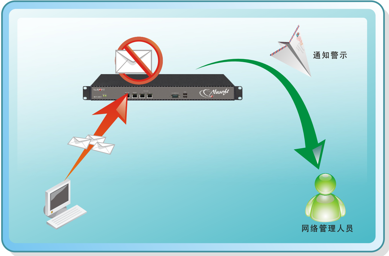
内部邮件寄送异常示意图

如此一来，不但让公司邮件安全多一层把关，同时也为管理人员多填增了管理搭配的灵活性。