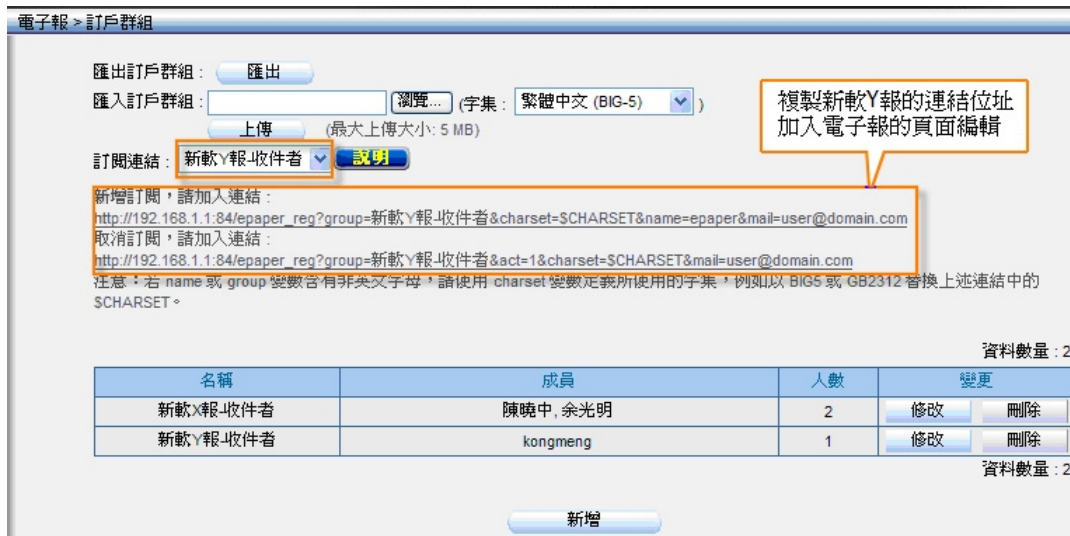
订阅连结 - 新软 Y 报订户群组地址

管理人员特别注意超级链接地址中，若 name 或 group 变量含有非英文字母，请使用 charset 变量定义所使用的字集，例如以 BIG5 或 GB2312 替换上述链接中的 $CHARSET。