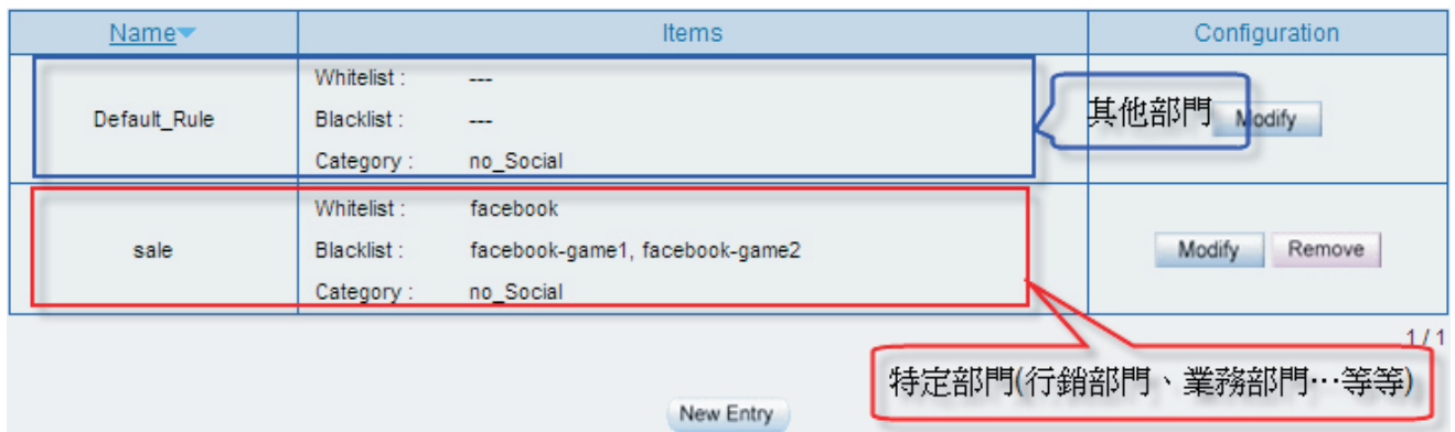
图四 勾选欲管制之网站类别之子项目

上述所设定完成的值，套用于不同群组中，再将群组设定于『使用者规则』的「默认规则」、「不管制规则」及「自订规则」三种之一，以达到管制员工上网种类之目的。