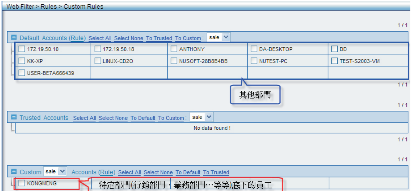
图五 套用于使用规则种类(预设规则、不管制规则、自订规则)

如此一来，管理人员可从Log记录中查阅开放或阻挡的列表及其它相关讯息，以供管理人员后续的存查与备份使用，并藉以调整公司网络政策。