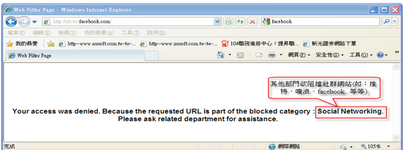
图七 其它部门进入facebook网站，系统阻挡画面

所以，不论「网站白名单、黑名单」或「网站类别数据库」完成设定后，必须得套用到『规则』中才会有实际的用途。