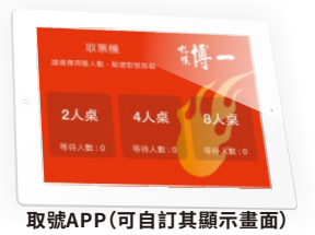
取號APP (可自訂其顯示畫面)

NDS-320 提供免費的「取號機 APP (支援 iOS、Android 系統)」，讓行動裝置立即變成專業取號設備；不需再採購貴森森的觸控取號器，改用廉價的 Android 平板，能大幅降低叫號系統建成本。